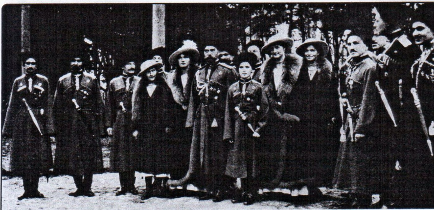
Государь император Николай II и цесаревич Алексей с офицерами. 1916 г.

Через несколько дней английский парламент громом аплодисментов встретил известие о низвержении Николая II. С уходом Государя рухнула и Россия. 50 думцев и 8 генералов совершали дворцовый переворот.