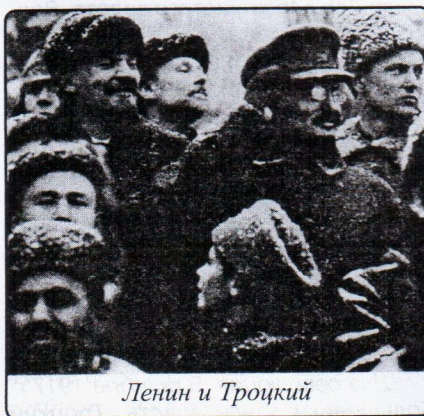
Ленин и Троцкий

Главным союзником Временного правительства по разрушению Русского государства была большевистская партия, возглавляемая В. И. Лениным.