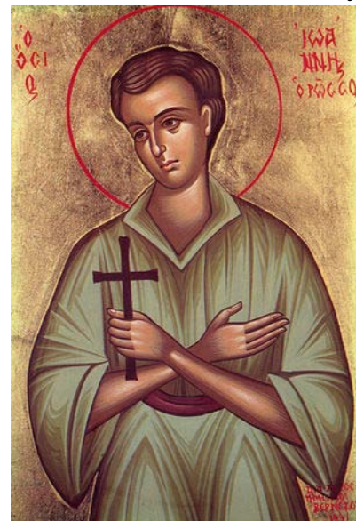
Святой Иоанн Русский

Мч. Иоанн Казанский (+ 1529, 24 января) умер после жестоких истязаний, которые перенес от татар за отказ принять ислам. В 1552 году своими единоплеменниками-мусульманами были замучены крещеные татары - свв. мчч. Петр и Стефан Казанские (24 марта). В Константинополе от турок-мусульман за исповедание христианства пострадали св. мч. Павел Русский (+1683, 6 апреля) и прмч. Пахомий (+ 1730, 7 мая). Отказался принять ислам и прославился добродетельной жизнью в турецком плену исповедник Иоанн Русский (+ 1730, 27 мая).