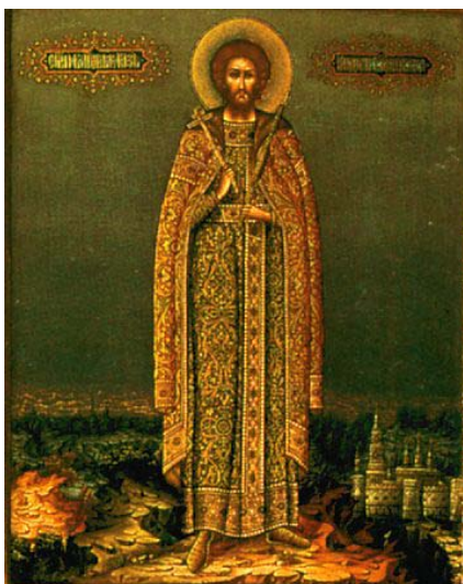
Св. благоверный князь Андрей Боголюбский

Сыновья св. кн. Владимира свв. Борис и Глеб (+ 1015, память 24 июля) канонизированы как страстотерпцы . Святые князья не были мучениками за веру в прямом смысле слова, они приняли мученическую кончину от рук брата по политическим причинам. Но Церковь не делает различия между смертью за Христа и смертью в последовании Христу. Господь «смирил Себя, быв послушным даже до смерти, и смерти крестной» (Флп. 2.8). «Яко Бог, Он всем правил, — пишет святитель Феофан Затворник, — и жизни Своей течение мог направлять Сам, но Он отрекся от Своей власти и смиренно принимал все случившееся и подчинялся тому... И тому даже не противился, когда подошла смерть, и притом такая униженная... Он это видел..., но ничему не воспротивился и добровольно принял смерть... Послушлив же во всем Он был не злобе людской, а определениям Бога, в Троице поклоняемого, выражаемым волею Отца Небесного». В этих словах, пожалуй, как нельзя более точно выражена суть подвига страстотерпцев: подобно Христу, они со смирением принимали смерть, приходящую к ним от «замыслов и волей человеческих» как выражение «воли Отца Небесного» и послушно покорялись этой воле. К страстотерпцам домонгольского периода причисляют также вел. кн. Игоря Киевского (+