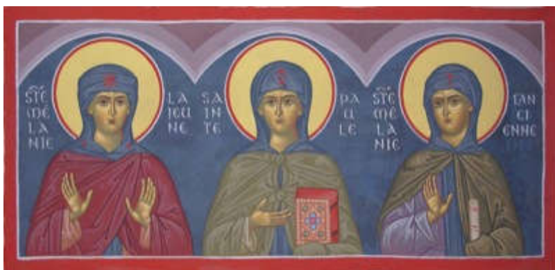
Свв. Мелания Младшая, Павла, Мелания Старшая

г. она почилла в монастыре на Елеонской горе.