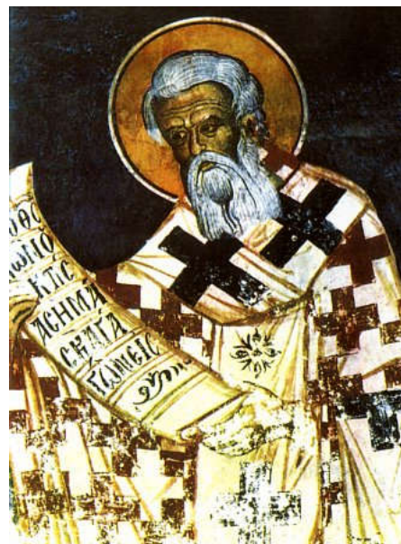
Свят. Афанасий Великий

Распространению на Западе аскетических идеалов Востока способствовали также блж. Иероним, Руфин, блж. Августин, прп. Иоанн Кассиан . Одним из главных носителей светлых идеалов христианского целомудрия на Западе, подготовивших почву для появления здесь монашества, был свт. Амвросий Медиоланский . Сам строгий аскет, он в своих проповедях и сочинениях