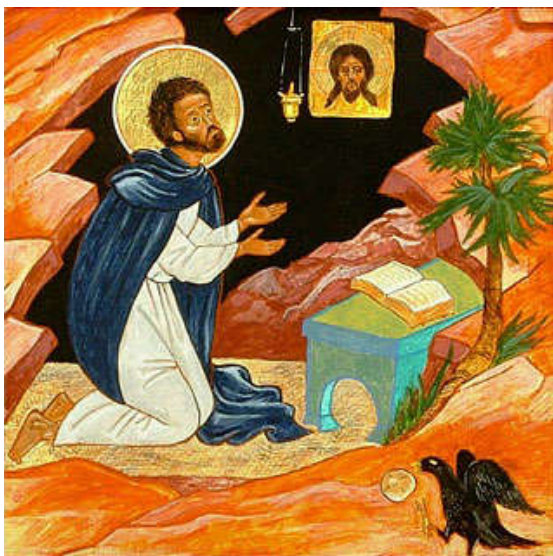
Прп. Венедикт Нурсийский

Сейчас на местах подвигов братьев есть две деревни: Сен-Лупикин и Сен-Роман. В приходских церквях хранятся мощи преподобных.