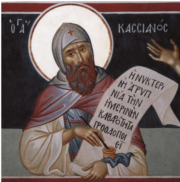
Преп. Иоанн Кассиан Римлянин

Еще один крупнейший подвижник Запада — преподобный Иоанн Кассиан Римлянин (ок. 350 - 435, память 29 февраля на Востоке, 23 июля на Западе) — считается одним из основателей монашества в Галлии и вообще на Западе. Хорошо зная латинский и греческий языки, он был как бы связующим звеном между Востоком и Западом, перенося на Запад аскетический опыт подвижников Египта и Палестины. Преподобный Иоанн Кассиан очень почитается и Восточной, и Западной Церковью.