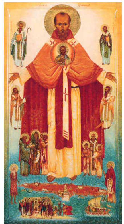
Свят. Гонорат Арльский

Остров Лерин лежит около побережья южной Галлии, напротив Канн. Из-за множества ядовитых змей он был необитаем. Там, при постоянных туманах, среди лесов, болот и диких зверей вместе с несколькими единомышленниками стал подвизаться св. Гонорат. Число иноков постоянно возрастало, они заселили не только Лерин, но и ближайшие острова. По своей форме жизнь Леринских иноков напоминала полуотшельническую. Братья жили в отдельных келиях и собирались вместе на богослужение. В уединенных местах Лерина и соседнего острова