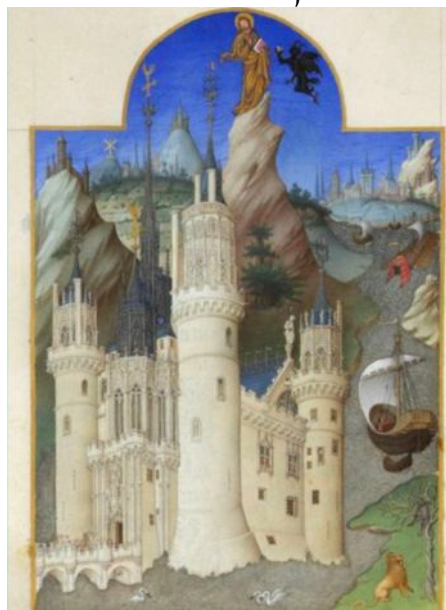
Братья Лимбурги. Миниатюра из «Великолепного Часослова герцога Беррийского», 1410-90 г.