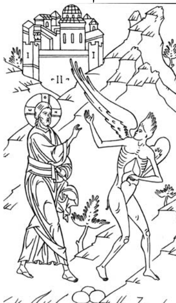
прорись иконы «Искушение Христа»